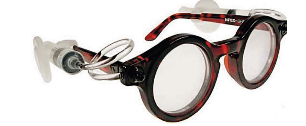
SÅDAN SER DE UD , de sygekassebriller, som den britiske fysiker Joshua Silver vil sælge til foreløbig en million fattige indere. Ved hjælp af sprøjterne på brillestængerne justeres væskemængden i linserne. Dermed kan linserne korrigeres med mellem +6 og -6. Når linserne er indstillet til den enkelte brillebruger, forsegles de, og sprøjter og slanger fjernes.

I Udenrigsministeriets bistandsafdeling tjener syns chefrådgiver Esben Sønderstrup at der er glædeligt, at Joshua Silver ser problemet som noget markedet kan løse, hvis pro-